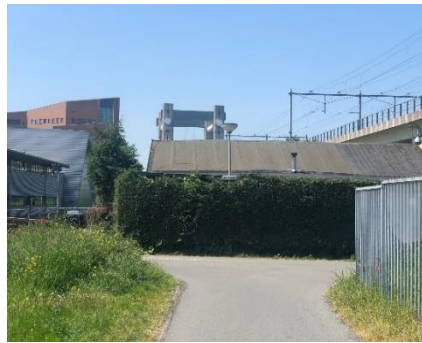
Kruispunt (linkerkant brug)

Aan het eind van deze weg slaat u opnieuw rechtsaf, het fietspad op. Houd hier rekening met (brom)fietsers. Blijf goed aan de kant wandelen of fietsen. Volg het fietspad circa 450 meter, tot u bij een brug arriveert. Aan de rechterkant van deze brug bevindt zich een tunnel. Deze passeert u. Ga de brug over en vervolgens nog ruim 200 meter rechtdoor.