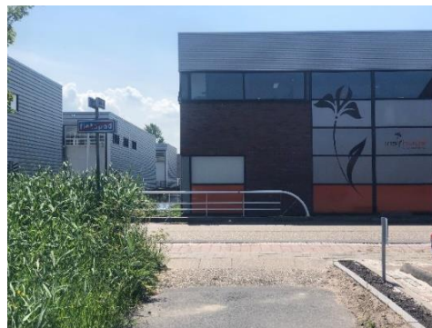
Einde fietspad (aankomst Meridiaan)