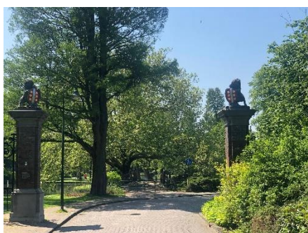
Ingang 'Van Bergen IJzendoorn park'

Met het station achter u en omringd door fietsen en stadsbussen, gaat u rechtsaf het station uit. Met een aantal stappen loopt u zo het 'Van Bergen IJzendoorn park' in. Deze weg volgt u 450 meter tot aan het eerste kruispunt.