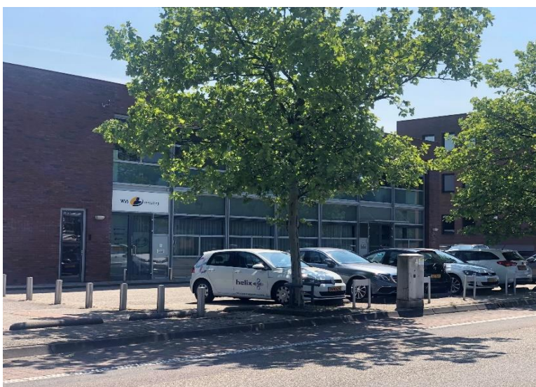
Gebouw WVS Consulting

Bij aankomst op het industrieterrein Meridiaan slaat u rechtsaf.