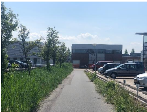
100 meter fietspad

Wanneer u het kruispunt nadert slaat u linksaf, opnieuw een brug over. Hier gaat u nog zo'n 100 meter rechtdoor op het fietspad. U arriveert op de Meridiaan.